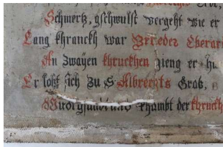
Abb. 1: Nach der Abnahme des Flickens, Ansicht von vorne.

(st). Bei der Restaurierung wurde auch der große Flecken im unteren Bereich der Leinwand entfernt (Abb. 1 und 2) und mit einer neuen Leinwand fachmännisch ausgebessert (Abb. 3). Mit einem Kreide-Leim-Kitt wurden die Fehlstellen geschlossen und schließlich die Malschicht ergänzt. Ein neuer Rahmen schloss die Restaurierung ab (Abb. 4).