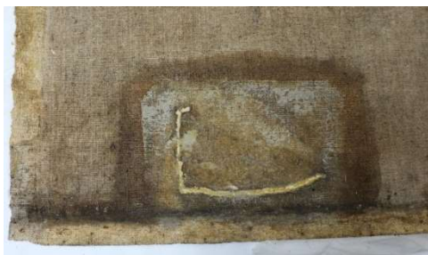
Abb. 1: Nach der Abnahme des großen Flickens war ein großer Riss in der Leinwand erkennbar, Ansicht von hinten.