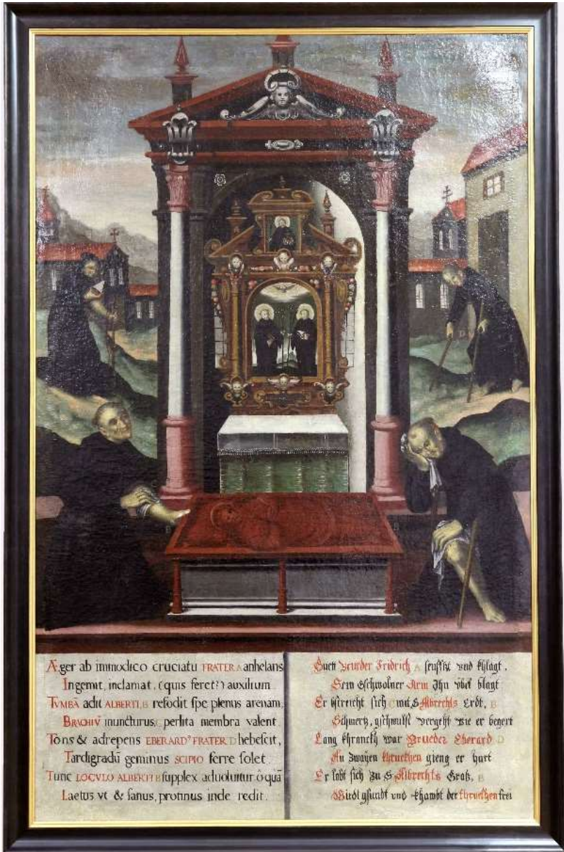
Abb. 4: Die Albertustafel 11 nach der Restaurierung.